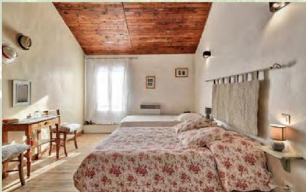
La Treille Dorée Gîte

Les charmes et les équipements de qualité des 11 gîtes de l'Oustaou du Luberon définissent l'état d'esprit de la vie provençale. Ici, les styles s'associent sans jamais renoncer au confort moderne.